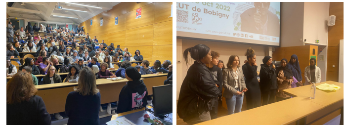
Images du Campus Ciné Festival 2022