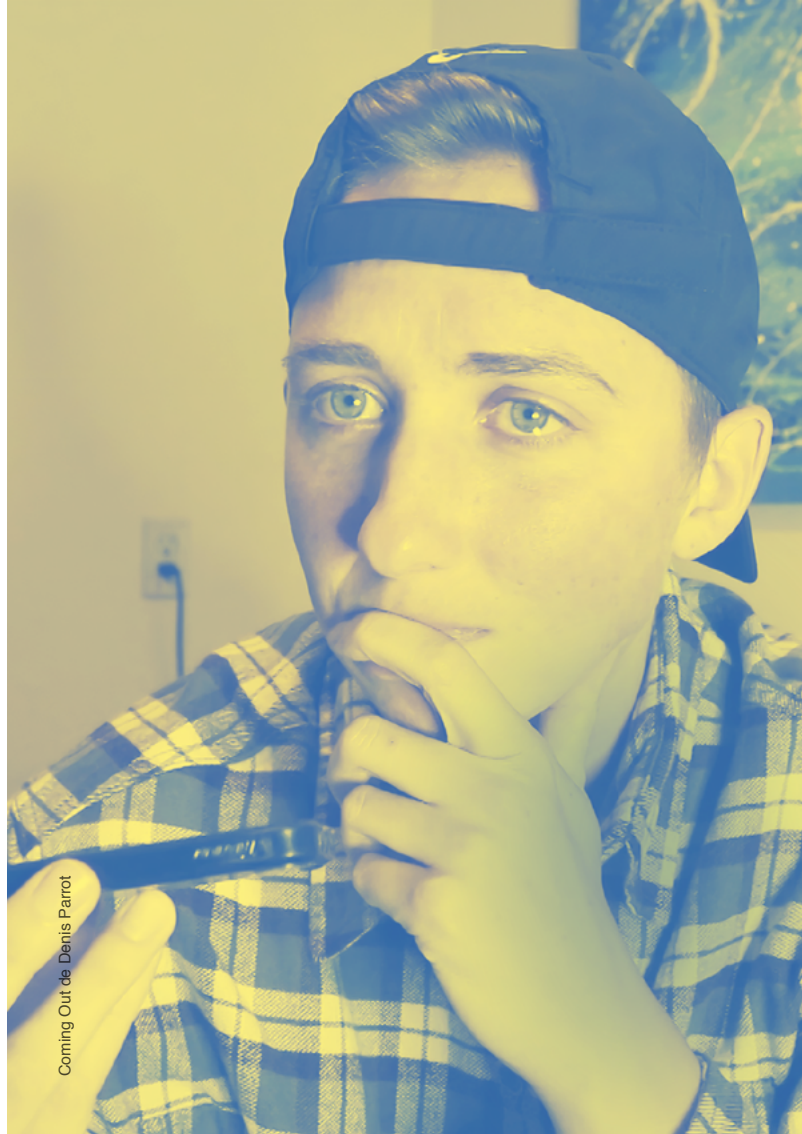
Coming Out de Denis Parrot

(M) 5 Station Bobigny-Pablo Picasso puis (T) 1 Station Drancy-Avenir